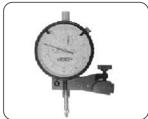
Удерживающий стержень Ø 8 мм в метрическом измерении